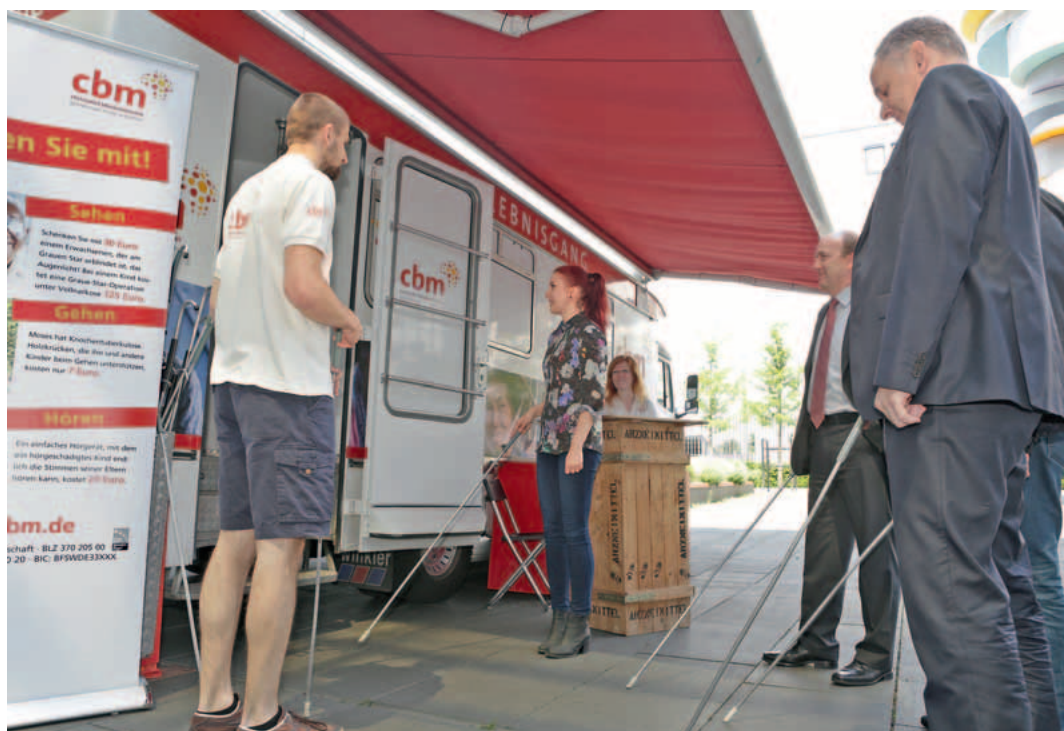
Blindenparcours für Sehende in einem speziellen Bus der Christoffel Blindenmission.