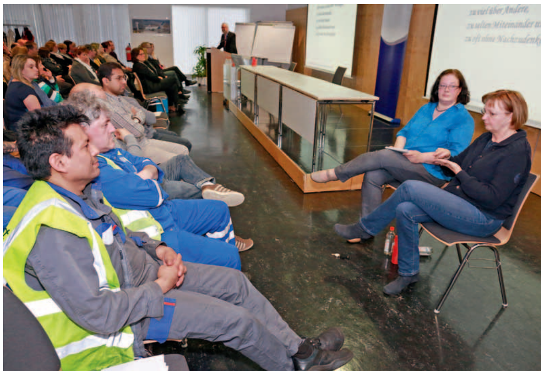
Gebärdendolmetscher im Einsatz bei einer Veranstaltung der Fraport AG.