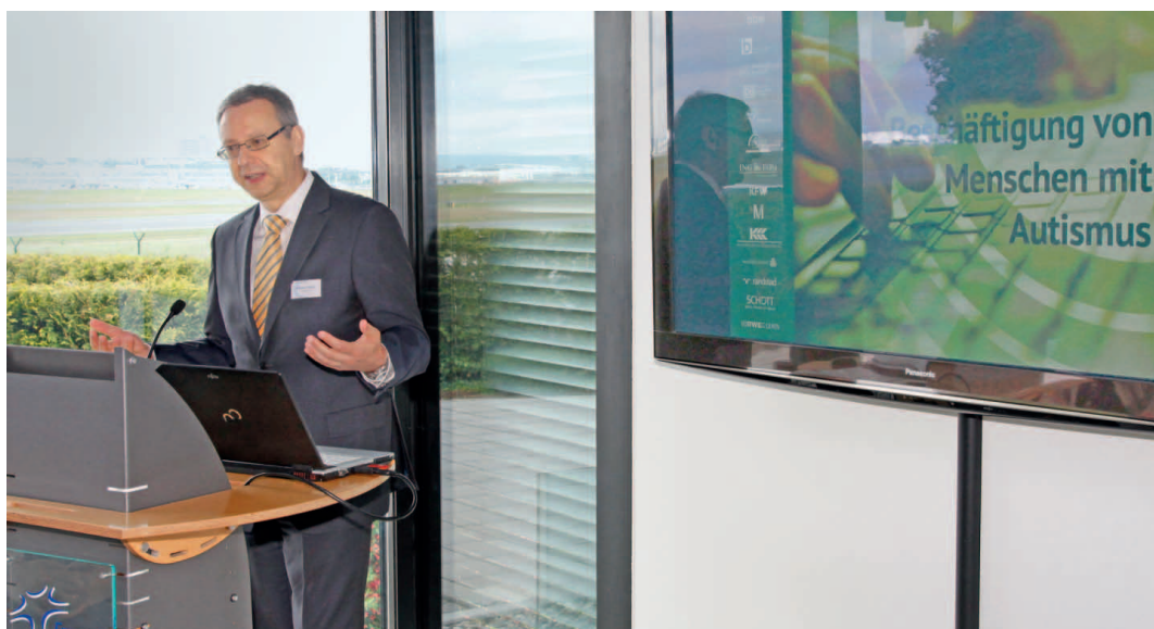
Austausch mit Experten und Betroffenen zum Thema „Autismus und Beschäftigung“.

beziehungsweise zu erhalten. Der Aktionsplan soll Schritt für Schritt mit Leben erfüllt werden, da nicht alle Vorgaben der UN-BRK sofort realisiert und umgesetzt werden können. Die Nachhaltigkeit der Maßnahmen ist dabei ein wichtiges Ziel.