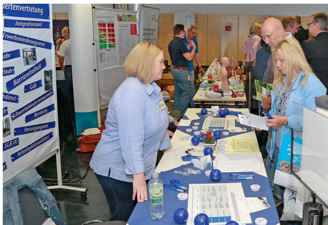
Gesundheitsmarkt der Fraport AG.