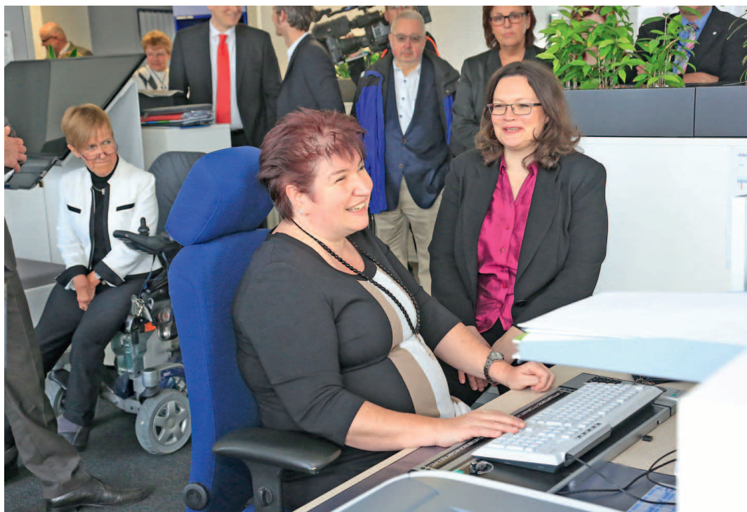
Bundesministerin Andrea Nahles informiert sich über einen blindengerechten Arbeitsplatz.