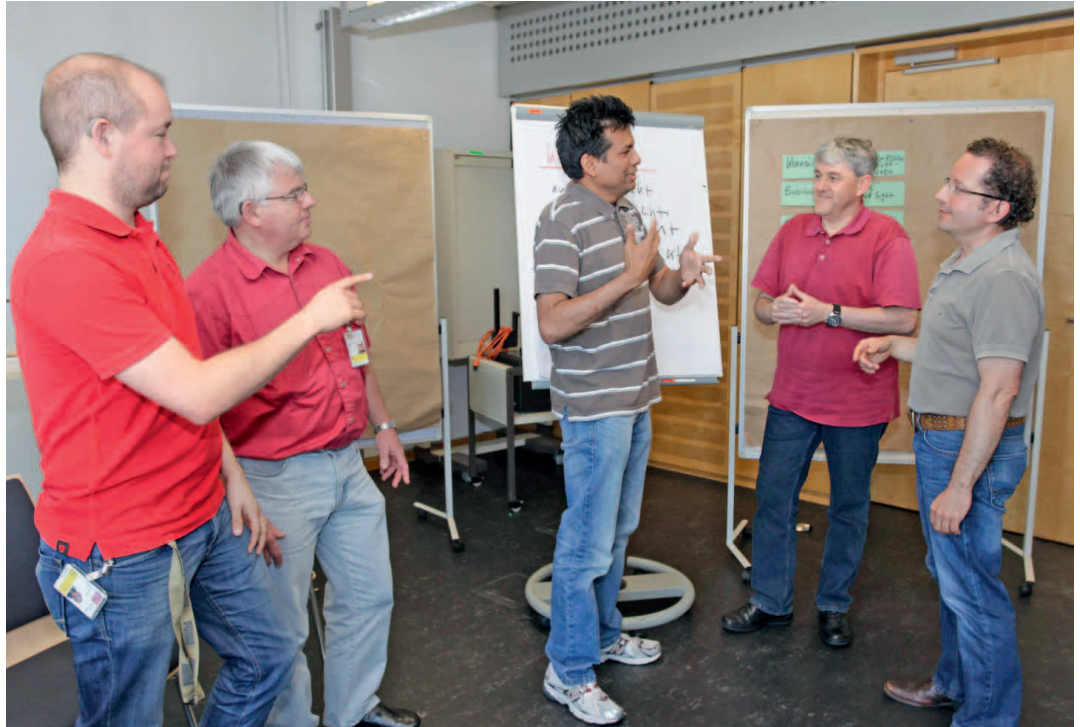
Seminar für gehörlose Mitarbeiterinnen und Mitarbeiter.