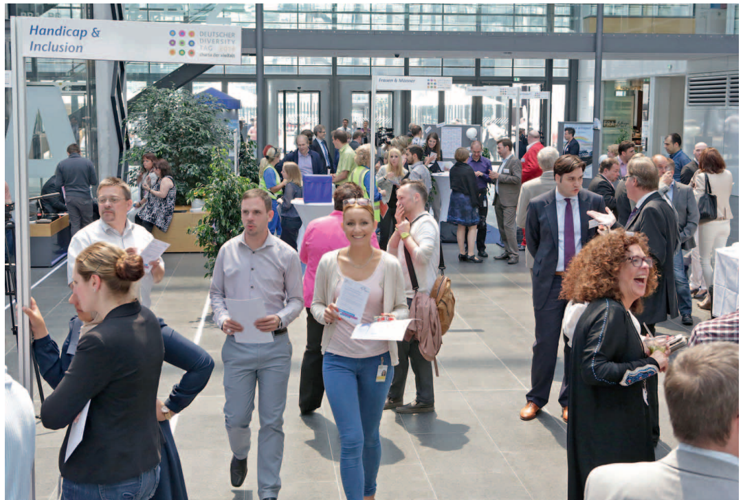
Infoveranstaltung zum 2. Diversity-Tag.