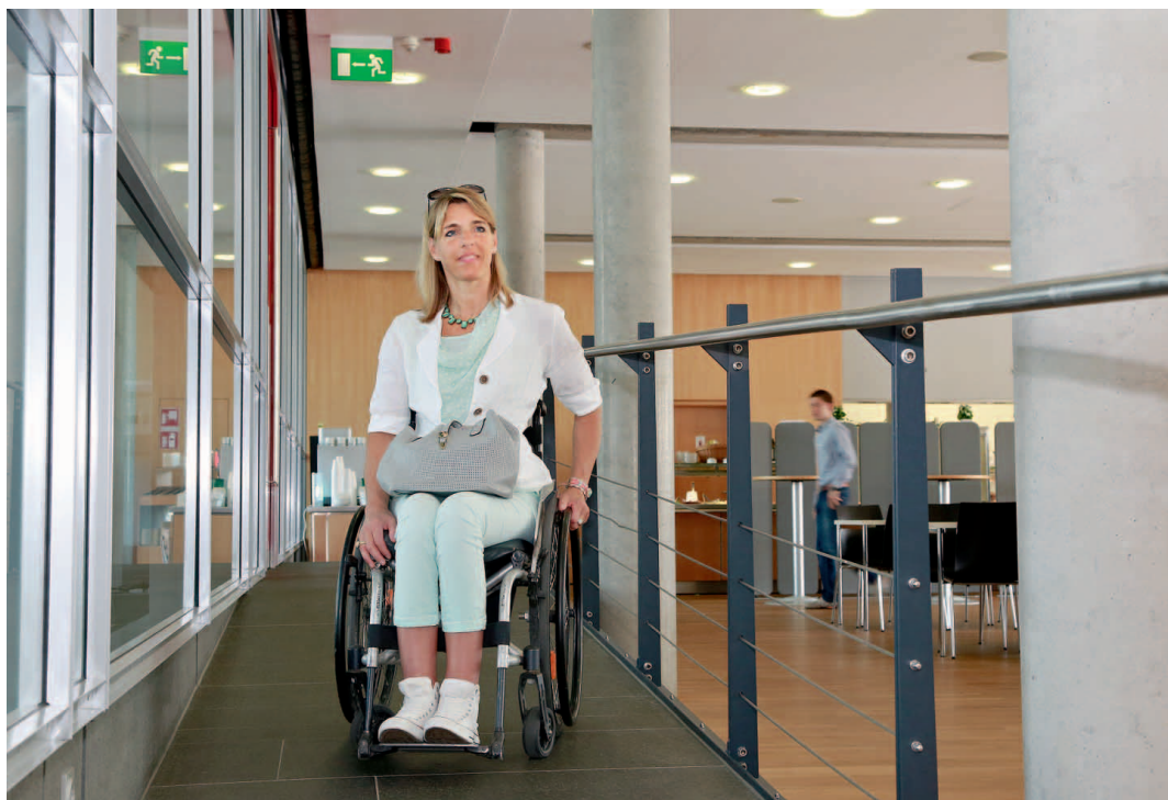
Barrierefreier Zugang zur Kantine in der AirportCity West.